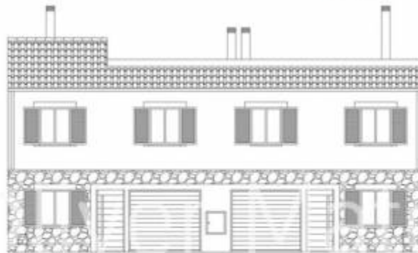
Alzado principal. Estado propuesto.